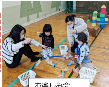
お楽しみ会 さかなつり遊び

4月のなかよし広場は「こいのぼり製作」です。こどもの日におけて、可愛いこいのぼりを親子で協力して作りましょう。初めての方もお友達と誘い合ってどんどん参加してください。