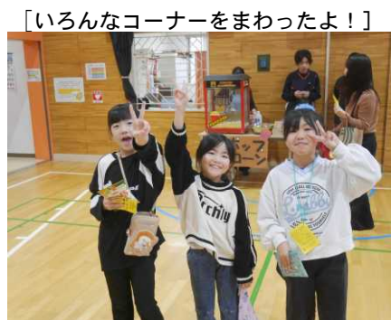
「いろんなコーナーをまわったよ！」