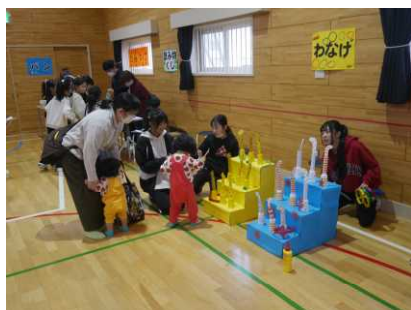
「KCCによる手作りのゲームコーナー」

手作り作品コーナーでは、アイロンビーズやデコパージュの花びんなどを出品しましたが、これも子どもたちとの共同作品です。当日はKCCの他、赤川中学校の総合文化部や3年バスケット部有志、母親クラブが会場準備や運営、後片付けまでお手伝いして下さいました。これぞ「地域ふれあい祭」の名にふさわしい、みんなで創るイベントになりました。たくさんのご参加とご協力、ありがとうございました。