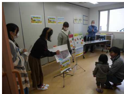
「函館短大、ほくでんのコーナー」